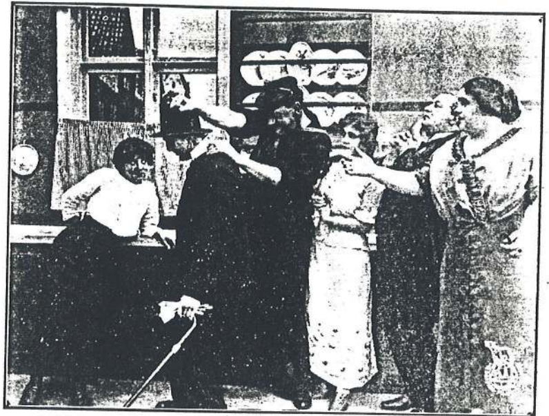
JACK A.B. ASSAULTS HIS LIEUTENANT.

who had meantime returned. There was a momentary assault by Jack, A.B. on Jack, the lieutenant, and the former almost fell through the floor in terror when he realised who he had attacked. In a few minutes, however, things were satisfactorily explained, and the two Annas and the two Jacks, rightly paired off, were soon chuckling over the experiences of the morning—each two in a quiet corner.